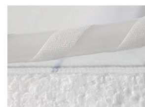
Rohr mit Klettbefestigung